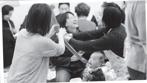
バルーンアートに挑戦！ 秋まつりにて

子どもからお年寄りまで、誰でも気軽に集まれる場所です。町内のみなさんの協力を得て、さまざまな行事を行っています。秋まつりでは、ザリガニ釣りをしたり、美味しいお芋を食べてみんなで楽しい時間を過ごしました。子育て中のお母さんどうしの情報交換や、高齢者との世代を超えた交流に参加してみませんか。