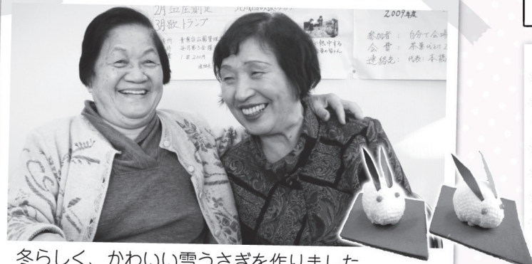
冬らしく、かわいい雪うさぎを作りました

小物作りや、食事会、血圧測定などを行っています。秋には発表会に向けて、手話歌の練習や、フルーツに合わせて歌の練習をしました。昨年の6月で10周年を迎えた、和気あいあいとして、笑い声の絶えないサロンです。