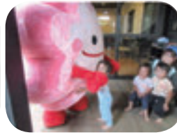
初めは緊張したけど… 仲良くぎゅーってできた！