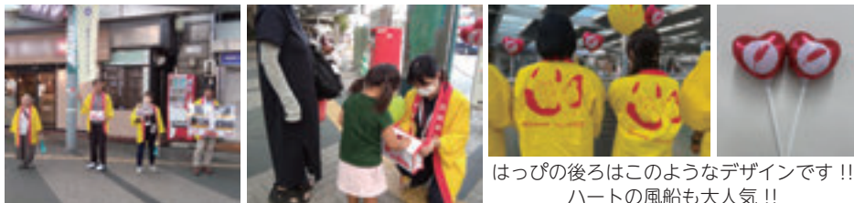
はっぴの後ろはこのようなデザインです！！ ハートの風船も大人気！！

地域の方々と一緒に朝霞市内で街頭募金活動を行い、180,079円の募金が集まりました。集まった募金は朝霞市内の地域福祉事業に活用させていただきます。みなさまの温かいご支援、ありがとうございました。