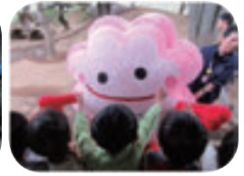
バイバイ！ また遊ぼうね！！

☆「るくるんのしあわせ探し」では、“しあわせ”のあるところにお邪魔します！あなたの近くの“しあわせ”教えてください！☆