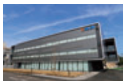
テイ・エス テック株式会社屋

『障害者就労施設パートナー企業認定等制度』は、障害者就労施設からの物品の調達や販売機会の提供等に積極的に取り組む企業・団体を、施設からの推薦や実績に基づき、埼玉県が認定するものです。栄町に本社を置くテイ・エス テック株式会社が、令和7年度障害者就労施設プレミアムパートナー企業として認定されました。本社屋内では、あさか福祉作業所及びはあとびあ福祉作業所がカフェ・売店「ル・クール」の受託運営を行っています。