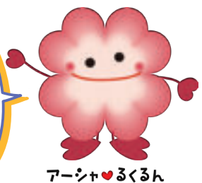
アーシャ♥るくるん