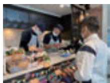
カフェ・売店「ル・クール」の様子

『障害者就労施設パートナー企業認定等制度』の詳細は埼玉県ホームページ(2次元コード)をご覧ください。