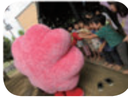
お兄さんお姉さんたち みんな元気いっぱい！

どろんこ保育園では、鶏50羽にヤギ、園庭では果樹を育てているんだって！果樹から成った実を加工し給食で食べたり、鶏は卵はもちろん、解体してお肉をいただいたり…食育を通じて「命の循環」を子ども達に伝えているそう！園のみんなはたくましくて元気いっぱい！みんなとハイタッチやジャンプをして、るくるんも元気をもらったよ♪ よし、しあわせ発見！！