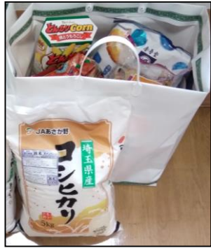
きよねん いちれい ▲去年の一例